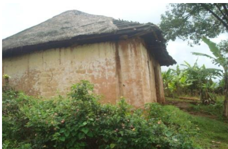
Cette maison en paille de la colline Kabumbe est habitée par une famille