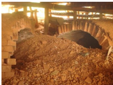
Le Principal four tunnel de la commune détruit