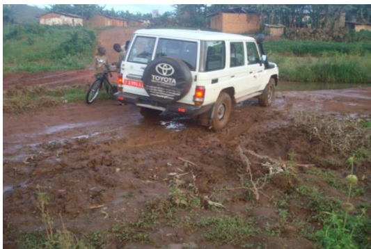
Cette piste mène au chef-lieu de la commune Buraza à quelques 100m