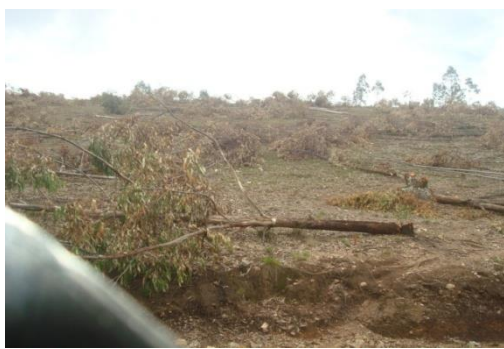
Coupe rase des boisements à Bibate