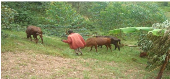
L'illustration de l'élevage traditionnel pratiqué à Buraza (colline Ndava)