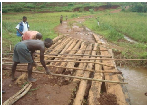
Ce pont est le principal qui mène à la colline Kabumbe