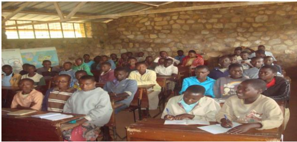
Cette classe de 6 ème de la colline Gisura compte plus de 70 écoliers