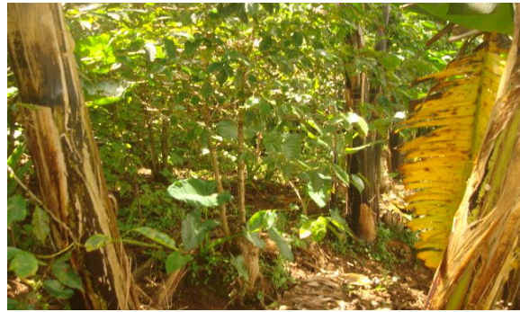
Une association de 5 cultures à Gisuru où certaines plantes étouffent les autres