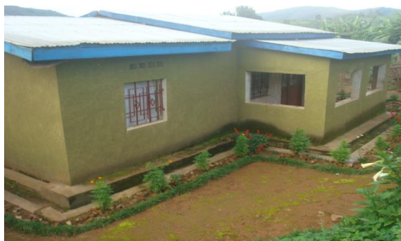
L'une des deux maisons de passage de Buraza au chef-lieu de la commune