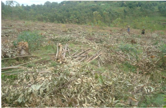
Coupe rase des boisements à Rweza