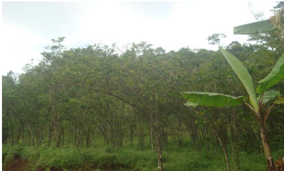
Une plantation de caféiers délaissés à Nyamisuru