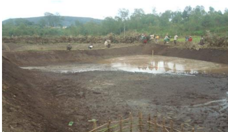
Des étangs piscicoles en aménagement