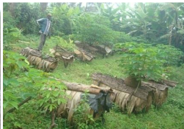
Un apiculteur exprimant le problème d'approvisionnement en ruches modernes